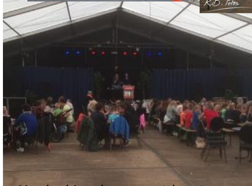
Hedenkingsboom met kerst